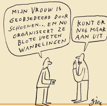
cartoon Gie Campo