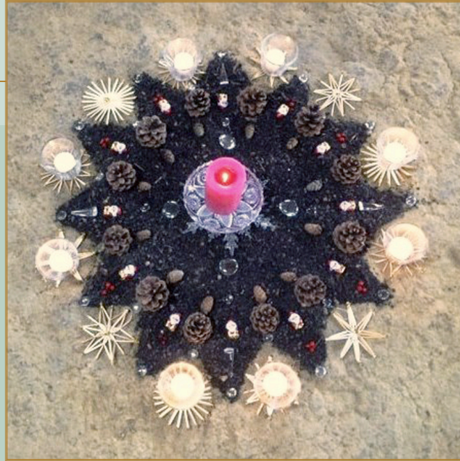
Kompost-Stern - Lied der Erde - Deutschland