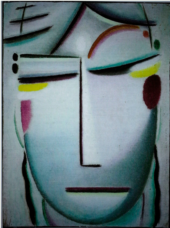
Alexej von Jawlensky, 1921